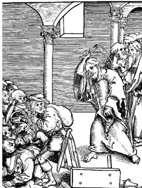
La purificazione del tempio secondo Lucas Cranach il Vecchio (1521)